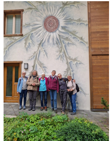
Joyeuse équipe de marcheuses, dans le haut du village d'Adelboden.

Nous avons pu découvrir également d'autres lieux, dont le château de Spiez.