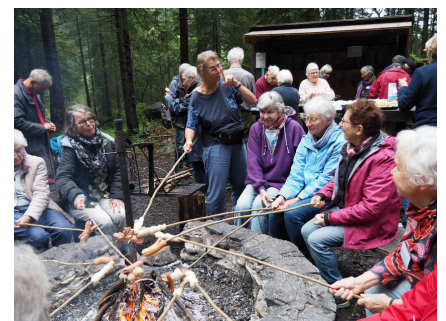
Comme des enfants...